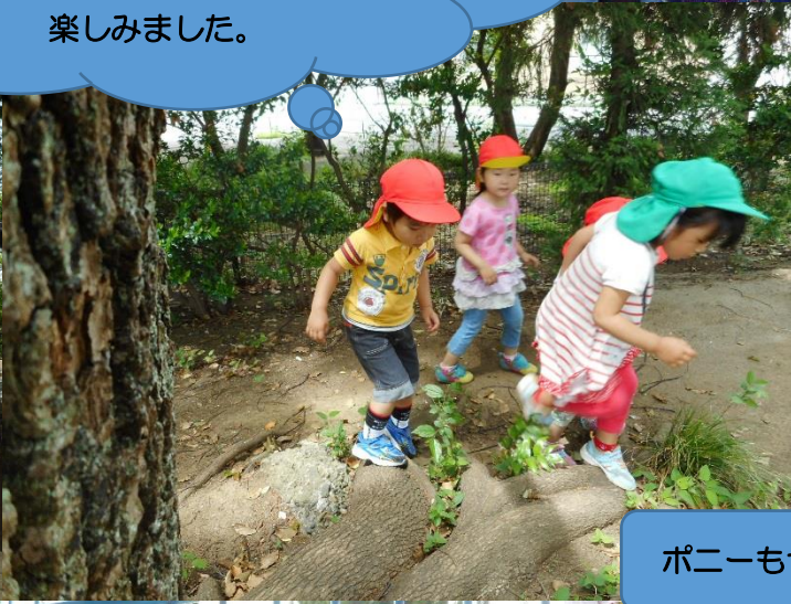
ポニーもヤギも大きかったね