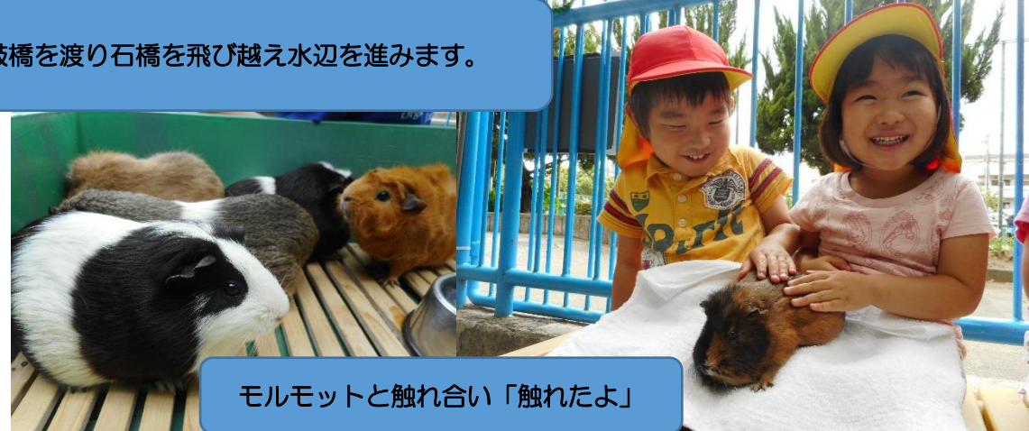
モルモットと触れ合い「触れたよ」