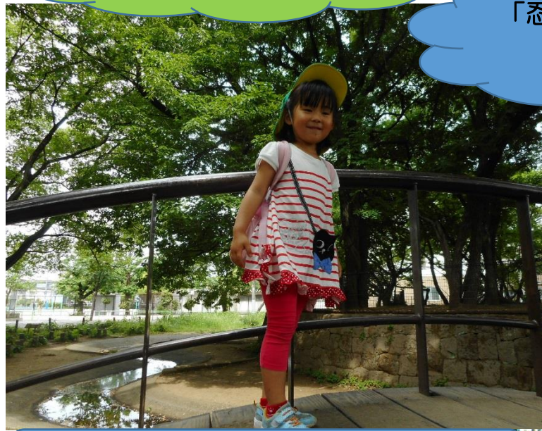
太鼓橋を渡り石橋を飛び越え水辺を進みます。