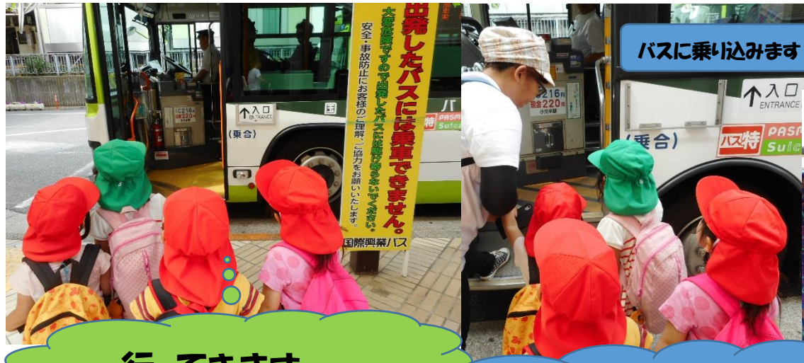
バスに乗り込みます

子どもたちと対話する時間を持ち、活発に自分の思いや意見を出し合い遠足の行先やバスで行くことなどをみんなで決めました。乗りたかったバスに乗り、行きたかったこども動物園へ出発です。